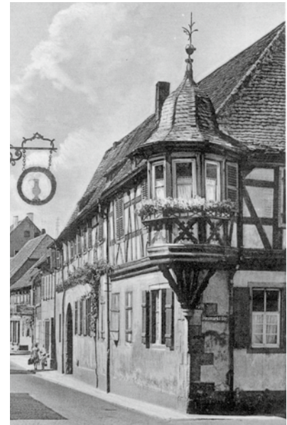
Postkarte um 1950

Nach umfangreicher Renovierung unter strengen Denkmalschutzauflagen bleiben die Gasträume in ihrem ursprünglichen Charakter erhalten. Bei den Arbeiten kommen alte Böden aus vorherigen Jahrhunderten zum Vorschein.