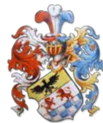
Familienwappen Matti anno 1480